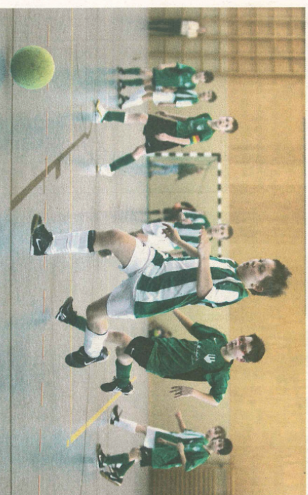
Ein Finale auf hohem fußballerischen Niveau zeigten die Spieler des FC Alsbach und der JSG Nieder-Beebach, dass die Nachwuchsfußballer des FC Alsbach mit 20 für sich entscheiden konnten.

Bei dem bundesweiten Wettbewerb zur Kundenzufriedenheit trifer Kfz-Werkstätten wählten die Autofahrer ihre bevorzugten Werkstätten in punkto Preiswertigkeit, Service, Qualität, Zuverlässigkeit, Pünktlichkeit und Hilfsbereitschaft. Bewertet werden dürften dabei ausschließlich